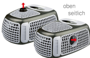
UM 90° SCHWENKBARER DRUCKANSCHLUSS