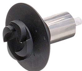
ENERGIESPAREND: PATENTIERTES LAUFRAD